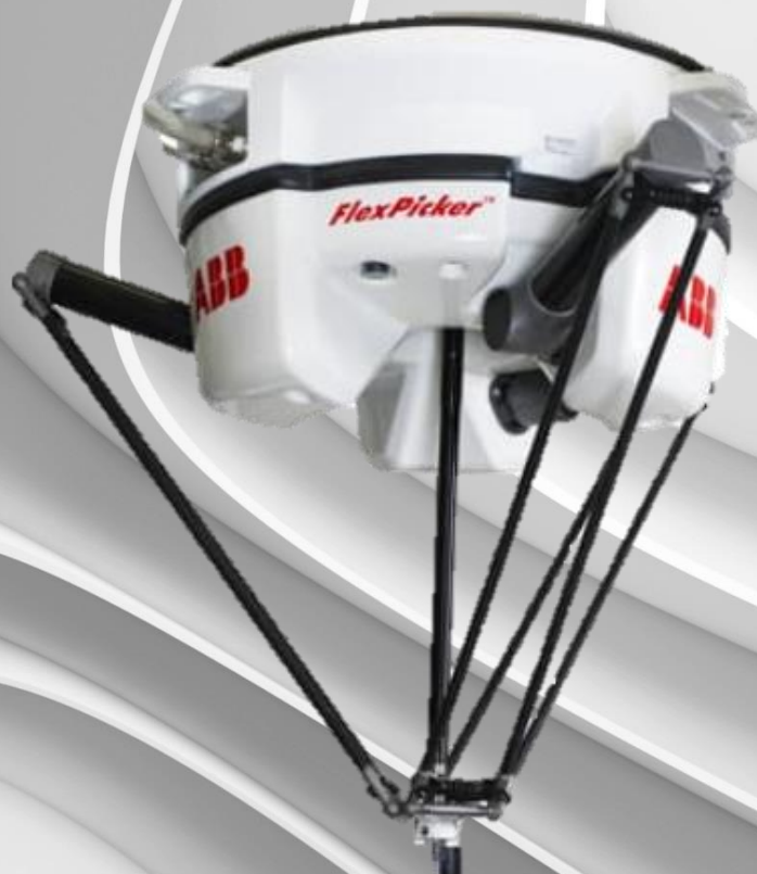
ABB CHILE, RARO, 12/03/2020